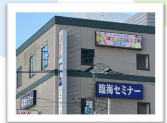
認定こども園 りとせ相模大野こども園 in 神奈中相模大野ビル 相模大野駅徒歩1分 TEL:042-705-5311