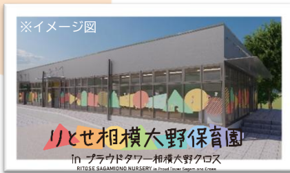
認可保育所 りとせ相模大野保育園 in プラウドタワー相模大野クロス 令和8年4月開所