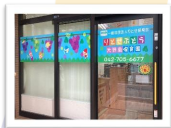
小規模保育事業所 りとせぶどう大野南保育園 相模大野駅徒歩2分 TEL:042-705-6677