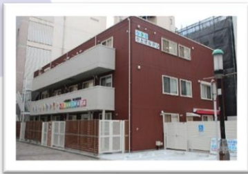
認定こども園 りとせ相模大野こども園 相模大野駅徒歩2分 TEL:042-705-4500