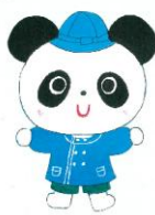
3歳児 ぱんだぐみ (11+3名)