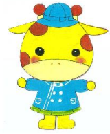
4歳児 きりんぐみ (12+3名)