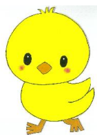
0歳児 ひよこぐみ (6名)