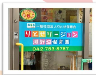
小規模保育事業所 りとせシーズン淵野辺保育園 淵野辺駅徒歩4分 TEL:042-753-8787