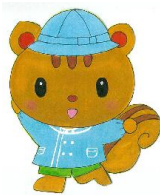
1歳児 りすぐみ (9名)