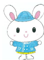
2歳児 うさぎぐみ (10名)