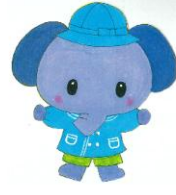
5歳児 ぞうぐみ (12+3名)