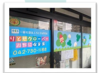
小規模保育事業所 りとせクローバー淵野辺保育園 淵野辺駅徒歩4分 TEL:042-730-1188