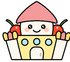
1歳児 おとぎぐみ (11名)