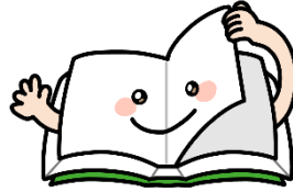
4歳児 ぺえじぐみ (11+3名)