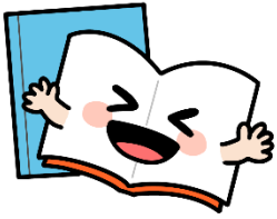
0歳児 えほんぐみ (5名)