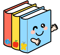
5歳児 ずかんぐみ (11+3名)