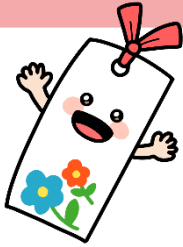
3歳児 しおりぐみ (11+3名)