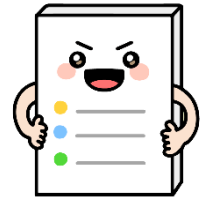
2歳児 もくじぐみ (11名)